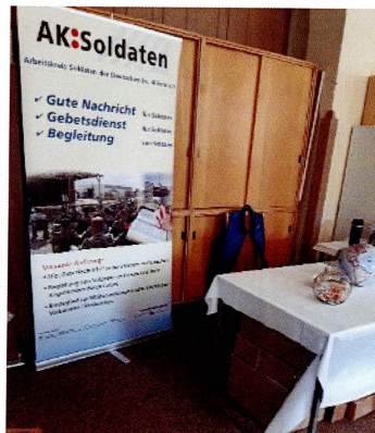
Info Stand AKS AKON 2024