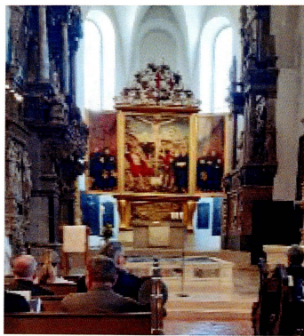
GeKo Weimar Herder-Kirche

1. Brief an Timotheus, 2, 1-4 (Hoffnung für Alle)